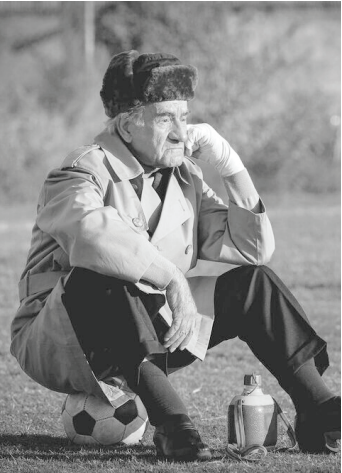
به سرانجام رسید و فیلم به طور مشخص