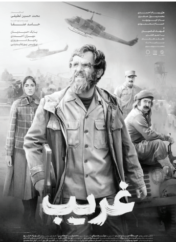
فیلم «پرویز خان»

اوج علاوه بر این فیلم، سراغ چند اتفاق واقعی دیگر نیز رفته است. محصولات قبلی چه تأثیری در آشنایی مخاطب با وقایع مغفول و نیت چهره‌های شاخص داشتند و آثار جدید دست روی چه موضوعاتی گذاشته‌اند؟ فیلم سینمایی «قرارگاه سری» سراغ بخشی از زندگی یکی از فرماندهان شاخص دوران دفاع مقدس یعنی سردار علی هاشمی رفته است. نام شهید هاشمی با اتفاقات مهمی گره خورده که یکی از آنها شناسایی و طرح‌ریزی عملیات خیبر در قرارگاه سری نصرت است، نام این قرارگاه به دلیل شناساسایی بیش از ۲۲۰ نفره در ایران و عراق، زیانزد است و از جمله نقش‌های مهم برای اثبات فرماندهی دقیق شهید هاشمی محسوب می‌شود. فیلم سینمایی «قرارگاه سری» به کارگردانی دانش اقباشاوی می‌تواند مخاطبان را با چهره این فرمانده شهید و نیز ماجرای مهم آشنا سازد.